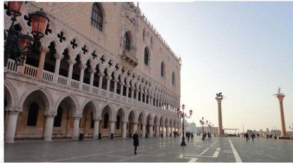
6. Piazza San Marco