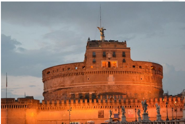
7. Castel Sant'Angelo